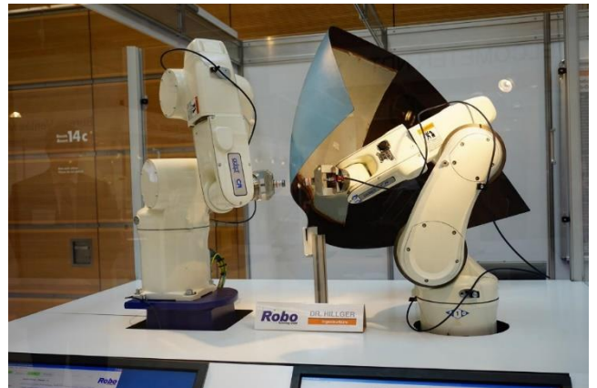
Bild 4: Durchschallungsprüfung von Bauteilen mit komplexer Geometrie

Eine Überführung in die Prüfpraxis gelang durch die Entwicklung einer serienreifen Prüfeinrichtung mit robusten Prüfköpfen, zuverlässiger Hardware und Software sowie einer einfach anzuwendenden, flexiblen und modularen Benutzeroberfläche. Zudem wurden optimierte Scanmechaniken für verschiedene Bauteilgeometrien entwickelt (Bild 2).