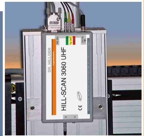
Am Scanner montierte Sender- und Empfangseinheit

Das bildgebende Ultraschallsystem USPC 3060 UHF ist optimiert auf die Prüfung mit hohen Frequenzen und liefert hochaufgelöste Befunde in Form von B-, C-, D- und F- Bildern. Es besteht aus einem Scan-System mit Tauchbecken und der externen Sende- und Empfangseinheit sowie einem 19"-Schrank mit Scanner-Controller und dem Ultraschallsystem sowie Monitor und Tastatur. Die einfach zu benutzende Software Hillgus für Windows™ ist modular aufgebaut und kann kundenspezifisch erweitert werden. Die Befunde lassen sich leicht in andere Windows™-Programme übernehmen.